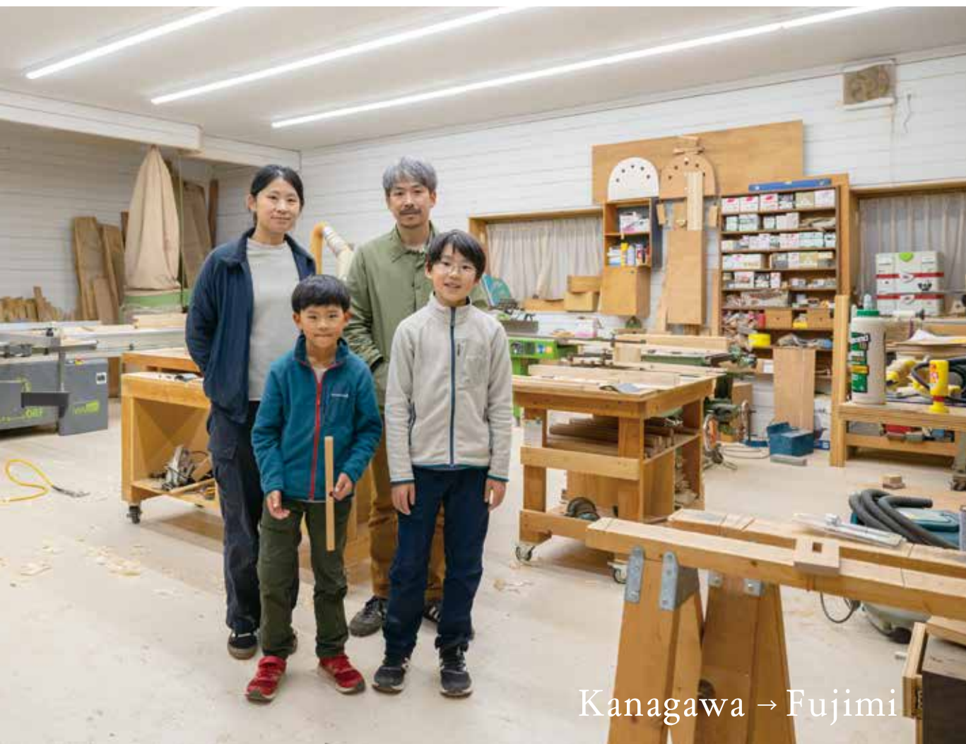
Kanagawa → Fujimi