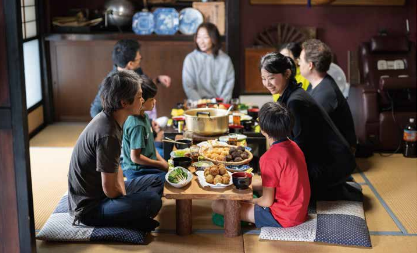
ウツリスム移住者交流会「古民家で郷土料理を味わおう！」